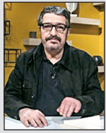
دلنوشته های آهان آهان دار محبوب صالح علا